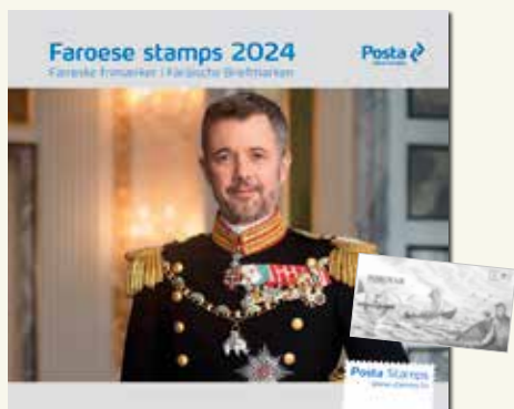
Livre de l'année 2024 + 1 impression noire gratuite. Prix : 735,- DKK